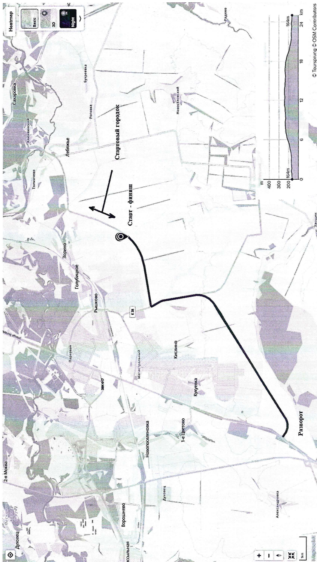
Схема маршрута индивидуальной гонки.